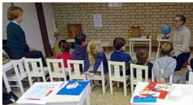
Le temps d'enseignement dans l'Atrium de Saint-Léon.

Le 3 e temps, c'est celui du travail. Comme lors du premier temps, l'enfant peut manipuler le matériel présenté juste avant ou lors des séances précédentes. Par exemple, pour